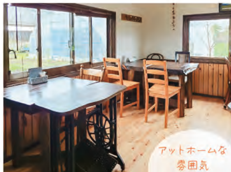
アットホームな 雰囲気