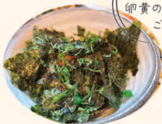
名物の 卵黄の醤油漬け ごはん