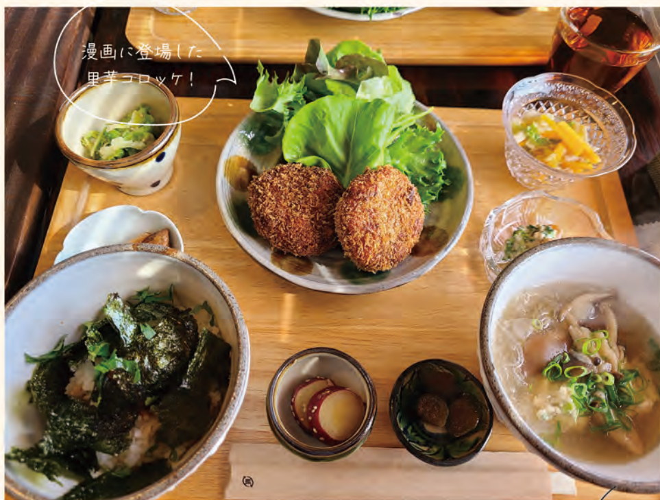
漫画に登場した 里芋コロッケ!